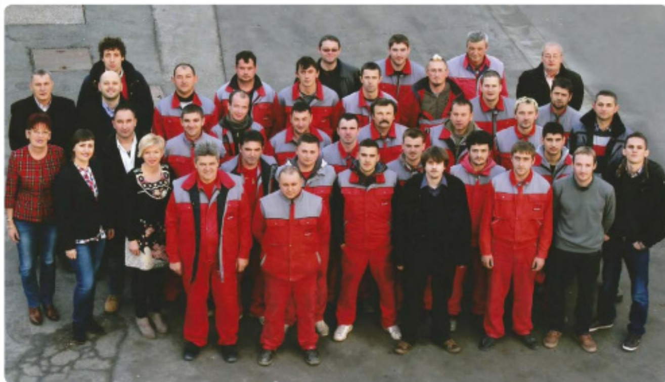
MI MARIS 20 godina