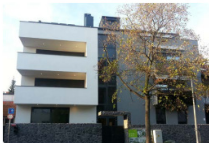
Stambeni objekt u Petrovoj ulici u Zagrebu

MI MARIS danas zapošljava oko 40 ljudi što uključuje upravu, vlastiti rač. servis, 3 inženjera u pripremi, odjel nabave i pripreme elektroprojekata, zatim odjel održavanja i intervencije, dok ostalih 30 ljudi radi na terenu. Instalateri se dijele na strojare i električare, imaju 7 atestiranih varioca za bakar, PHD i dr. Ti su dečki dobro uigrani i točno se zna tko je za što zadužen, tko je stručnjak za određeni segment. Takav se tim ljudi stvara godinama, a mnogi su u tvrtki 15 godina što govori o kvaliteti tvrtke MI MARIS.