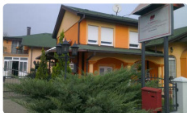
Obiteljska kuća i sjedište tvrtke

Pored toga mnogo rade za grad Sisak gdje imaju daljinsko upravljanje i očitavanje plina, vode i temperature za velike sustave. U zgradu „Kazališta 21“ također je ugrađeno nekoliko Vaillantovih uređaja o kojima vode brigu.